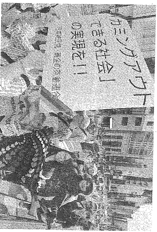
性的少数者への理解を広げようとして開かれたパレード